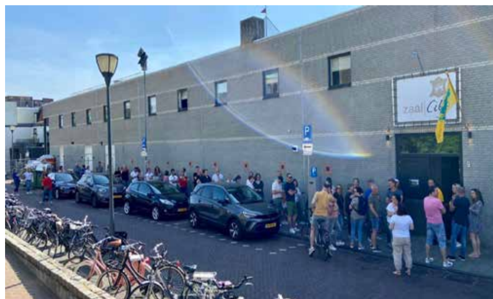
Afhalen van het Kwisboek 2022

Wij van de Wijkkrant wensen organisatie, deelnemers en toekijkers veel plezier en succes. En... vergeet niet dat deelnemen nog altijd belangrijker is dan winnen.