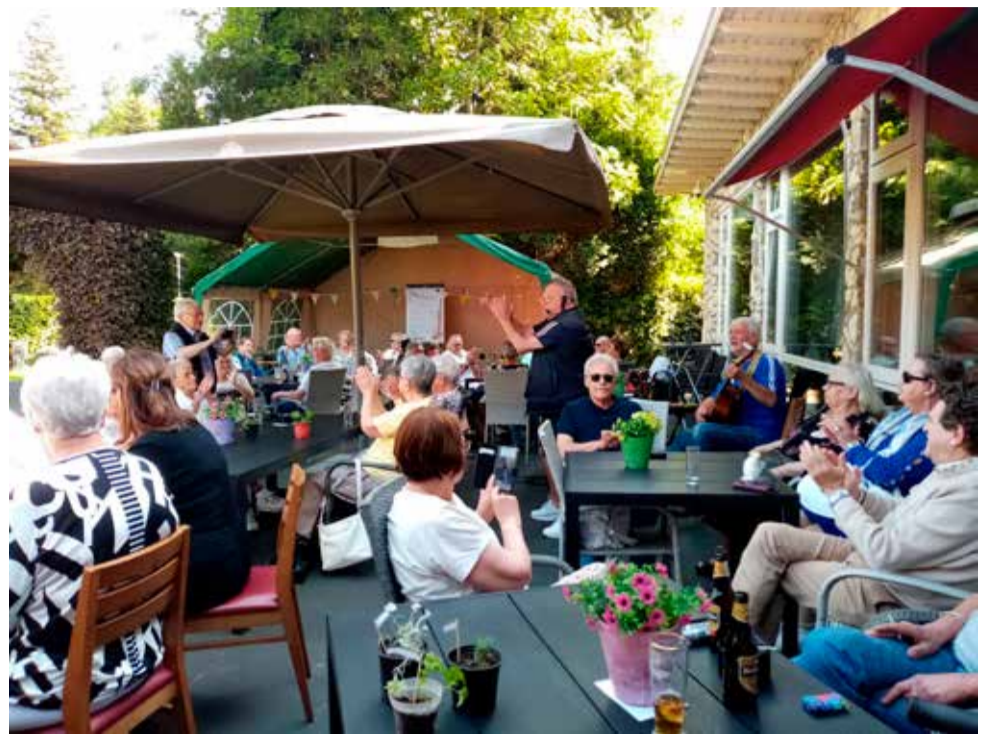
Veel muziekoptredens deze zomer op het sfeervolle terras van het Parkpaviljoen.

Als u wilt weten wat er de rest van deze zomer te doen is in het Parkpaviljoen, hou dan de facebookpagina in de gaten. U bent alvast van harte welkom, of het nu is voor een bakje koffie of voor een grotere activiteit. Het Parkpaviljoen is een stichting zonder winstoogmerk, daarom zijn de consumptieprijzen laag en wordt er geen entree gevraagd. De vele vrijwilligers zetten hun beste beentje voor om het u naar de zin te maken. Tot ziens in het Parkpaviljoen!