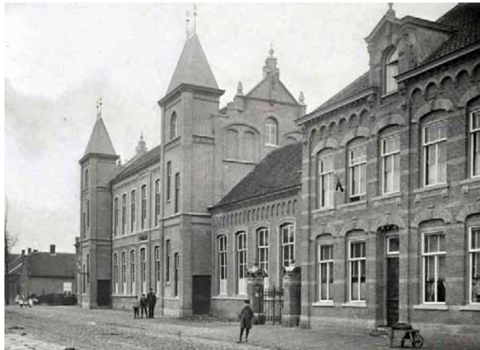
Straatbeeld uit 1930 met links de school en rechts de woning van het schoolhoofd