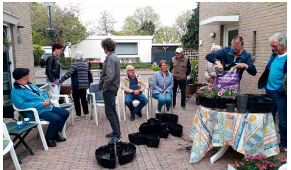
Buurtgenoten komen ook voor de gezelligheid.