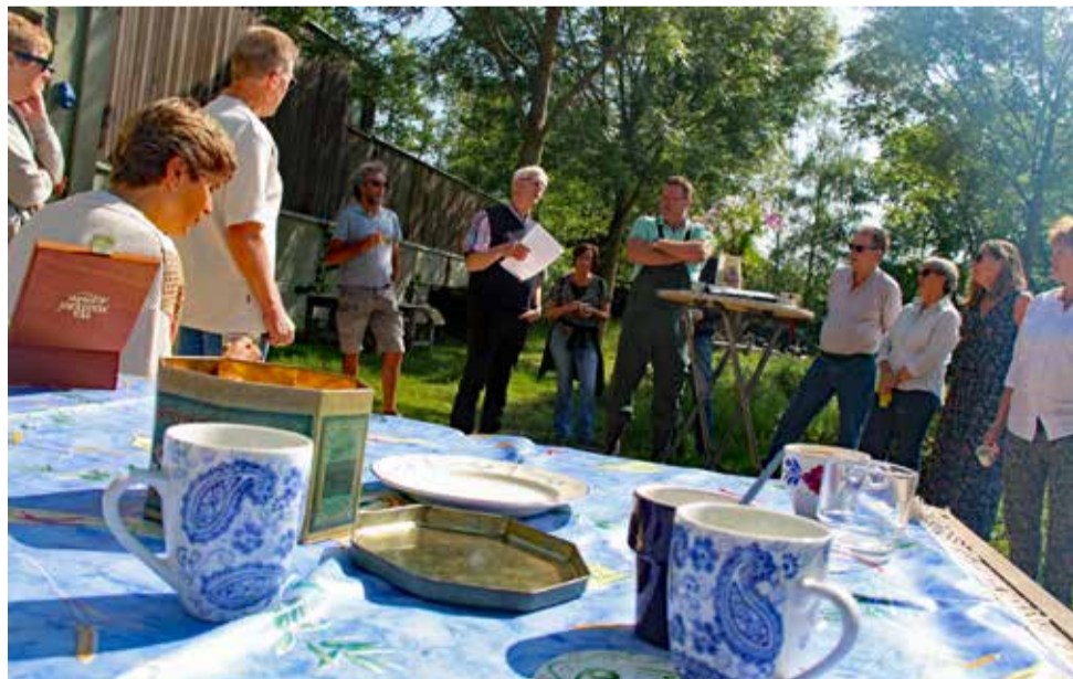
Medio mei: bijeenkomst in de Samentuin te Sprang-Capelle.

www.facebook.com/herenboerendelangstraat www.delangstraat.herenboeren.nl e-mail: delangstraat@herenboeren.nl