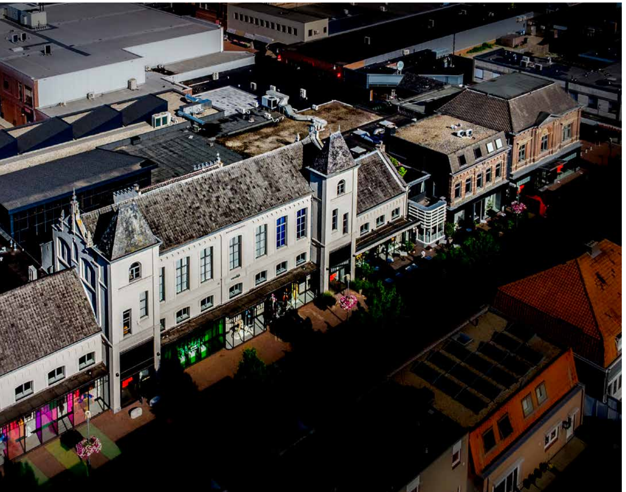
vlr school, woning schoolhoofd en Teekenschool anno 2022

door de prachtige ornamenten in de bovengevel weer voor eenieder zichtbaar waren. Modehuis Van Dijk valt van buiten op door de klassieke voorgevels, gecombineerd met moderne etalages. Binnen is het niet anders: oude materialen, antieke elementen, hout en staal wisselen elkaar organisch af. De zaak heeft vaak iets weg van een curiosawinkel Niet alle spullen hebben met mode te maken. Ze staan in zijn winkel omdat Hans graag een omgeving schept waarin hij het zelf naar zijn zin heeft. Lachend merkt hij op: "Ik ben immers vaker hier op de zaak, dan thuis". In 2019 werd op het parkeerterrein van het Modehuis een betonnen ruimte gecreëerd, het zogenaamde Atrium. Van-